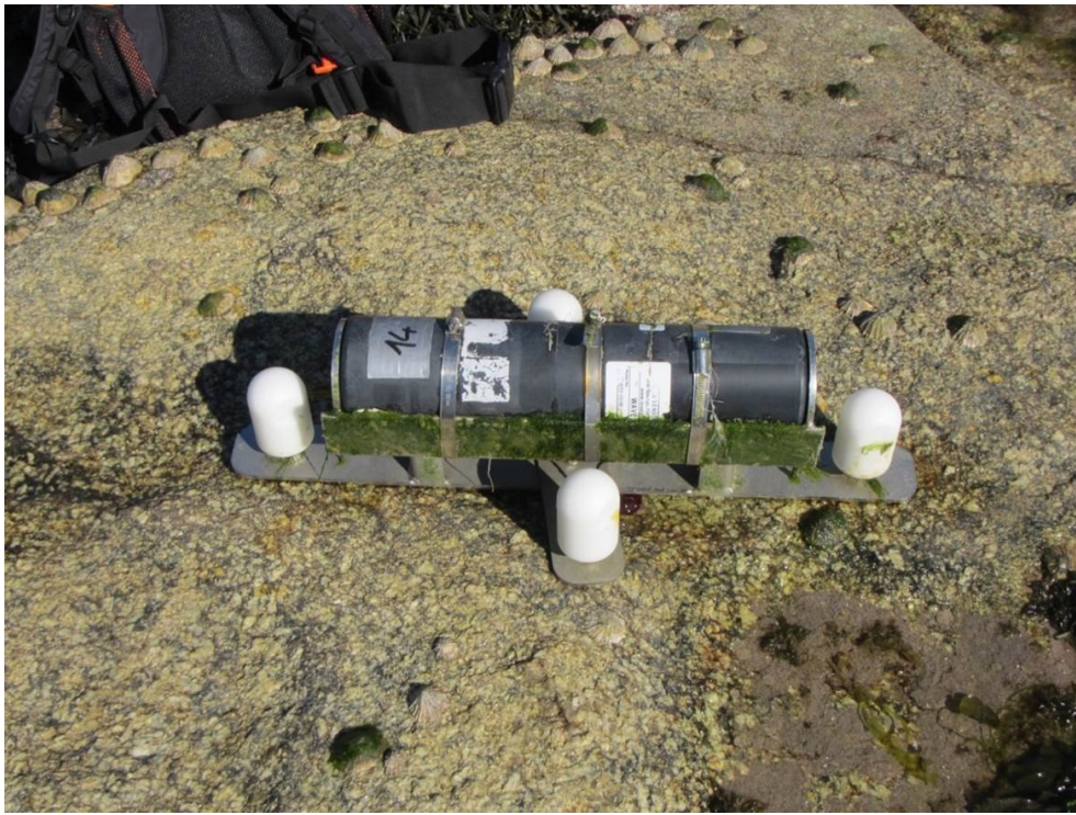
Photo 3 : Capteur de pression de type OSSI installé dans son support inox et fixé à la roche à l'aide de tige filetées protégées par des capuchons plastiques.